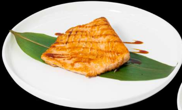
163. TEPPANYAKI SAKE € 12,00 salmone alla griglia allergeni:4