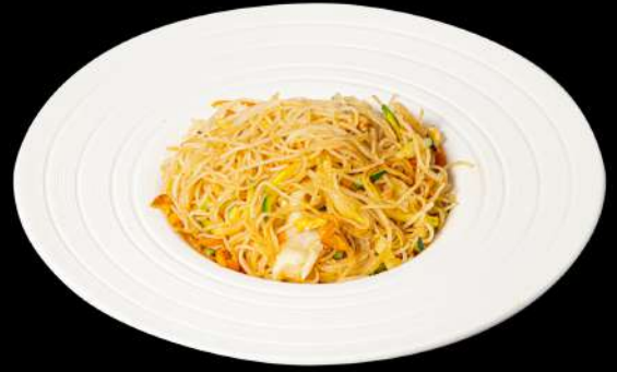
136. SPAGHETTI DI RISO YASAI € 5,00 spaghetti di riso saltato con verdure allergeni:3