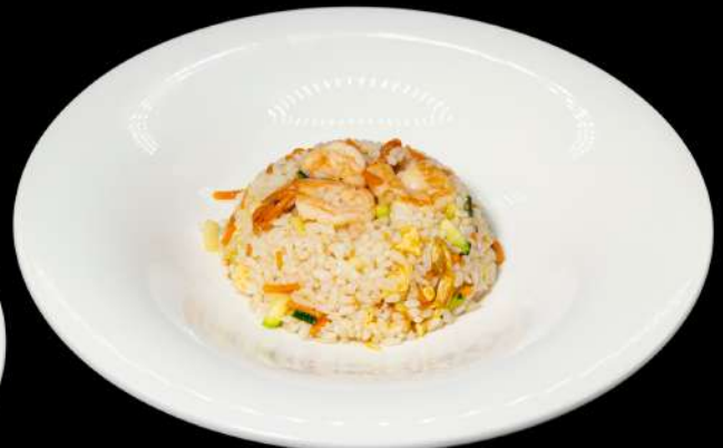
129. EBI MESHİ € 6,00 riso saltato con gamberi e verdure allergeni: 2.3