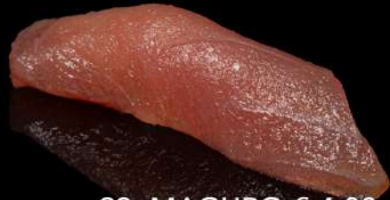
93. MAGURO € 4,00 tonno allergeni: 4