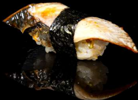
98. UNAGI € 5,00 anguilla allergeni:4