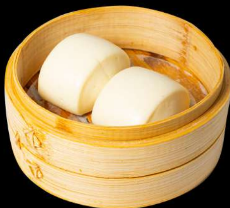
20. PANE AL VAPORE € 3,00 allergeni:1.7