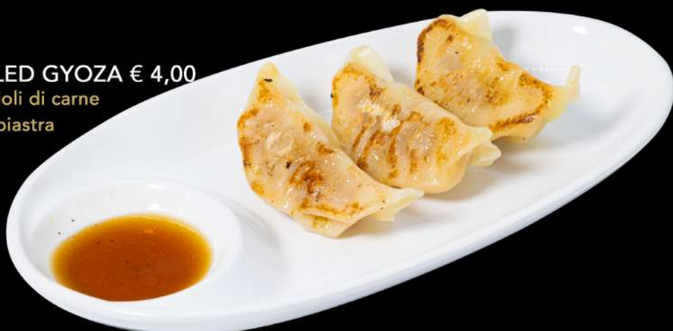
23. GRILLED GYOZA € 4,00 3 ravioli di carne alla piastra