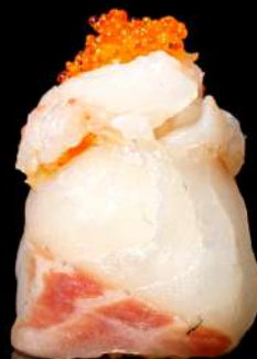
113. GIO AMAEBI € 4,00 allergeni:2.4