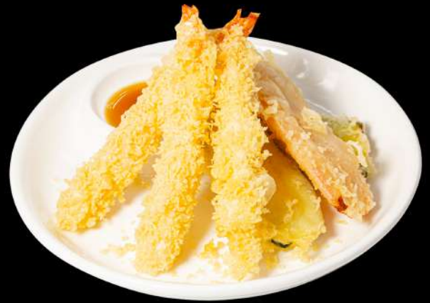
157. TEMPURA MISTA € 10,00 gamberoni,verdure fritto allergeni:1.2