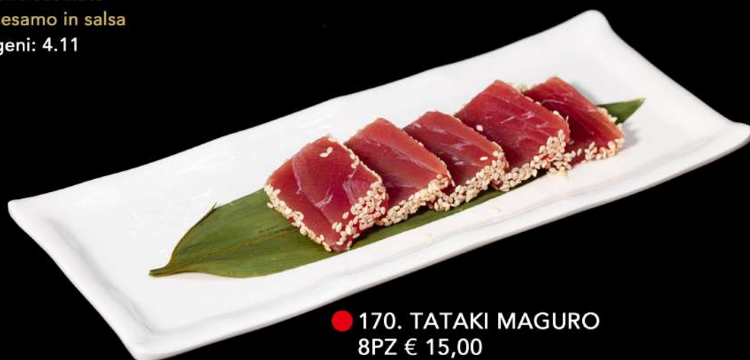
● 170. TATAKI MAGURO 8PZ € 15,00 tonno scottato con sesamo in salsa allergeni: 4.11