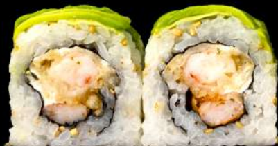
73. DRAGON ROLL gambero fritto,insalata,maionese, avocado all'esterno,teriyaki allergeni:1.2.3.6