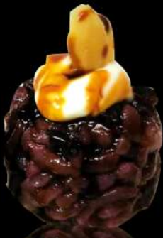
118. PHILADELPHIA € 4,00 riso venere, philadelphia, mandorle e teriyaki allergeni:4