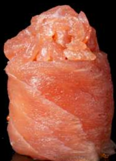
111. GIO SPICY TUNA € 4,00 🍣 tartare di tonno piccante, tobiko allergeni:4