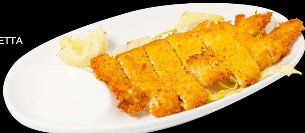
162. COTOLETTA DI POLLO € 6,00 allergeni:1