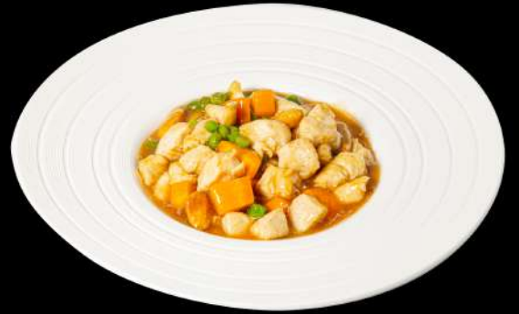
141. POLLO CON MANDORLE € 8,00 allergeni:8