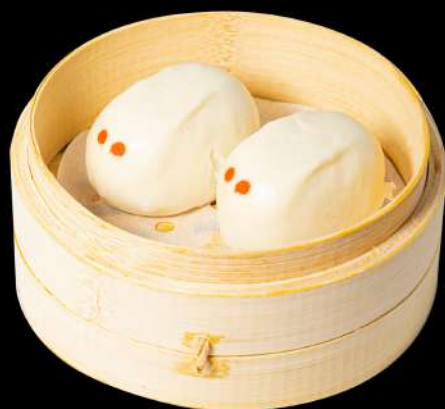
22. PANE CREMA AL VAPORE € 4,00 allergeni:1.3