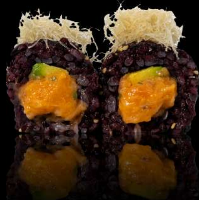
77. BLACK SPICY € 10,00 🌶️ salmone piccante, spicy maio, mandorle allergeni:4.3.8.1