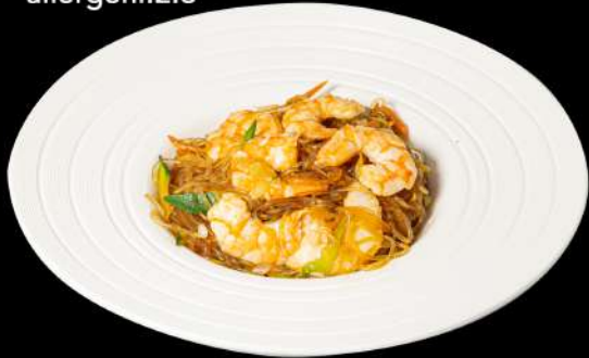
137. SPAGHETTI DI SOIA EBI € 6,00 spaghetti di soia saltato con gamberi e verdure allergeni:2