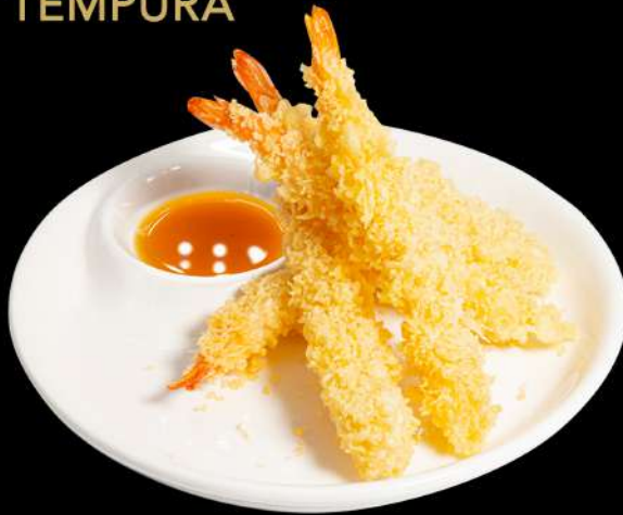
156. TEMPURA EBI € 12,00 gamberoni fritto allergeni:1.2