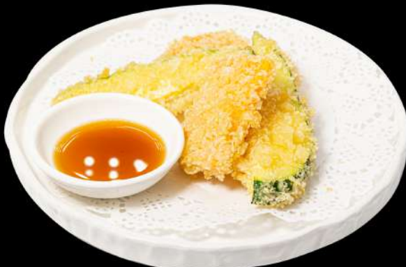
158. TEMPURA YASAI € 8,00 verdure fritto allergeni:1