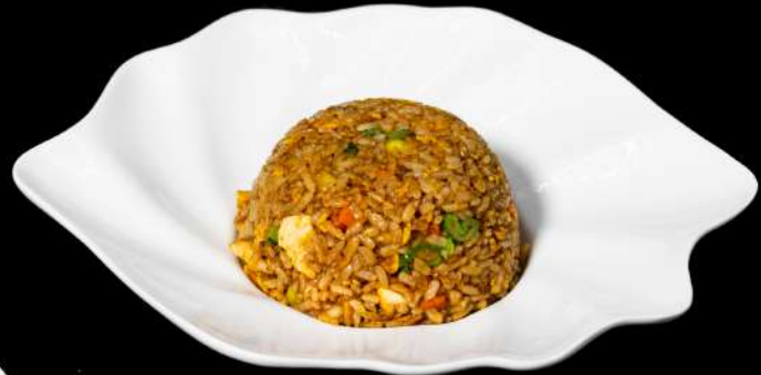
126. TERIYAKI MESHİ € 6,00 riso saltato con verdure, pollo teriyaki, uova e pasta kataifi allergeni: 2.1.6