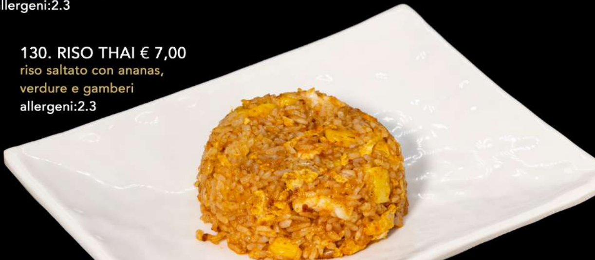
130. RISO THAI € 7,00 riso saltato con ananas, verdure e gamberi allergeni: 2.3