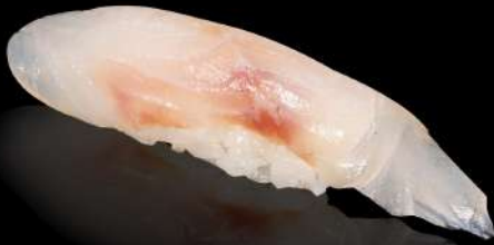
94. SUZUKI € 4,00 branzino allergeni: 4