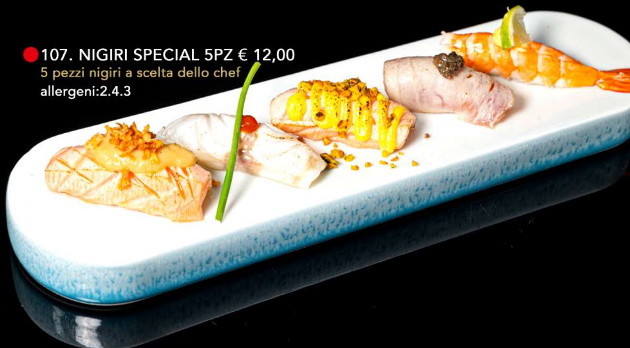
● 107. NIGIRI SPECIAL 5PZ € 12,00 5 pezzi nigiri a scelta dello chef allergeni:2.4.3