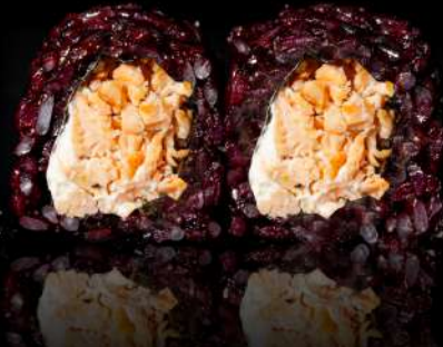
78. BLACK MIURA € 8,00 salmone cotto, philadelphia, teriyaki allergeni:4.7.6