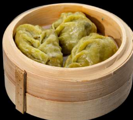
21. YASAI GYOZA € 4,00 3 ravioli di verdure allergeni:1