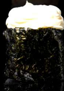
117. GUNKAN PHILADELPHIA € 4,00 bocconcino di riso con Philadelphia avvolto da alga allergeni: 7