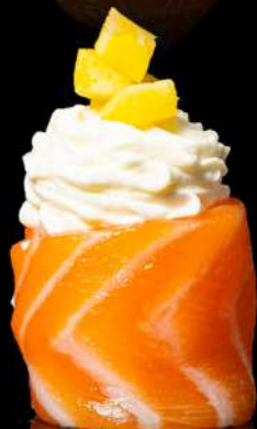
110. GIO MANGO € 4,00 philadelphia, mango, salsa mango allergeni:4.7