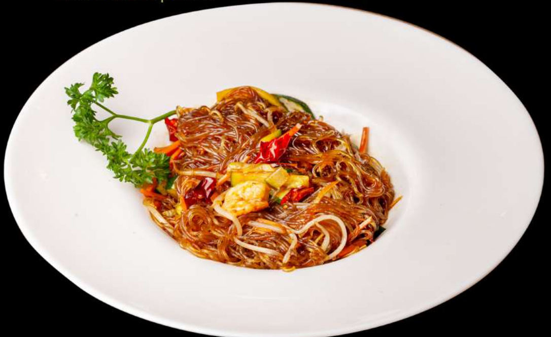
139. SPAGHETTI DI SOIA PICCANTE € 6,00 🌶️ spaghetti di soia saltato con carne e verdure piccante