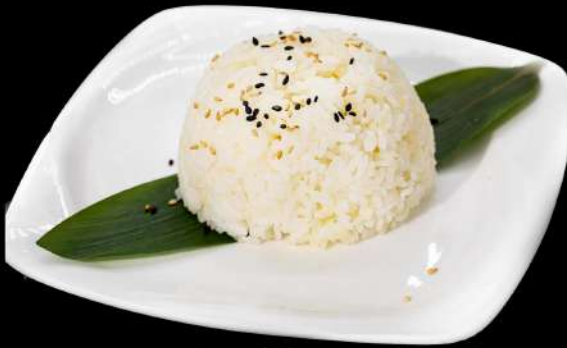
125. GOHAN € 3,00 riso bianco allergeni: 11