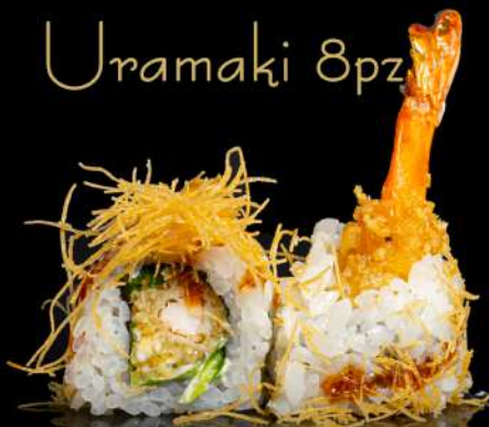
69. EBITEN € 10,00 gambero fritto,insalata, maionese,salsa teriyaki allergeni:1.2.3.6