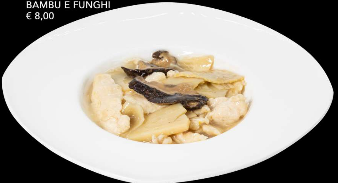
144. POLLO CON BAMBU E FUNGHI € 8,00