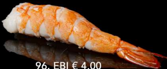
96. EBI € 4,00 gambero cotto allergeni: 2