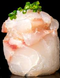
114. GIO SÚZUKI € 4,00 tartare di branzino allergeni:4