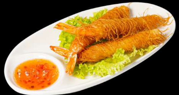
161. GAMBERO KATAIFI € 9,00 gamberoni avvolti con pasta kataifi allergeni:1.2