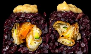
80. BLACK YASAI € 10,00 riso venere, verdure miste fritte, all'esterno salsa merluzzo allergeni:1