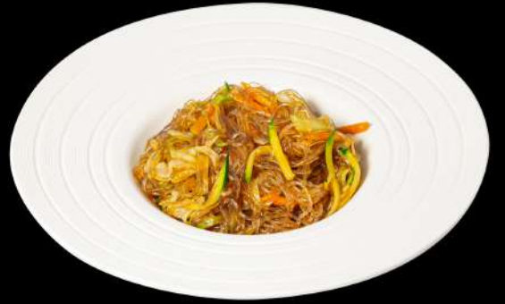
138. SPAGHETTI DI SOIA YASAI € 5,00 spaghetti di soia saltato con verdure