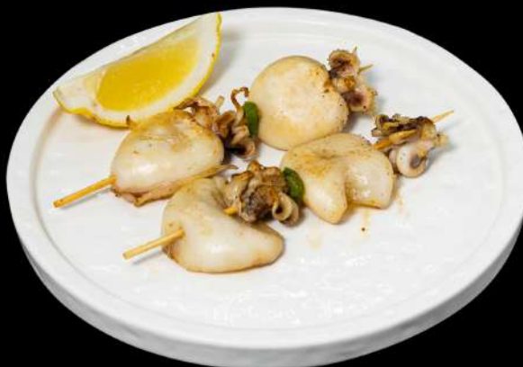
167. YAKI IKA 4PZ € 10,00 spiedini di seppia allergeni: 4.14