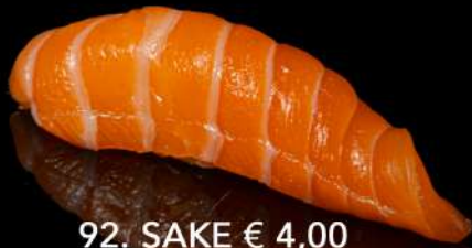
92. SAKE € 4,00 salmone allergeni: 4