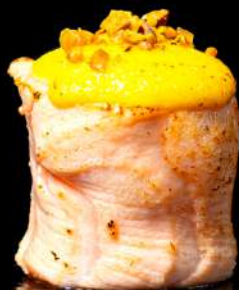
112. GIO FLAMBÉ salsa flambé, pistacchio allergeni:4.8