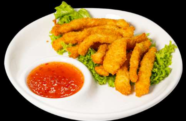
159. POLLO FRITTO € 5,00 allergeni:1