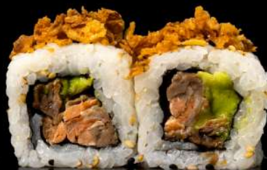
75. CROCCANTE ROLL € 11,00 salmone cotto,avocado,all'esterno philadelphia,cipolla fritta, salsa teriyaki allergeni:1.4.7.6