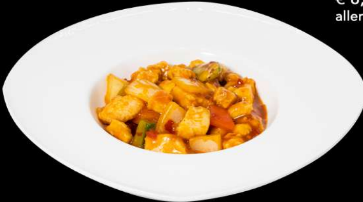
142. POLLO CON PICCANTE 🌶️ € 8,00