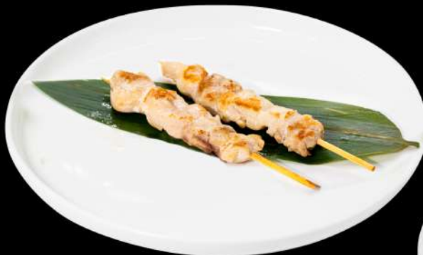
165. YAKI TORI 4PZ € 8,00 spiedini di pollo in salsa teriyaki allergeni:6