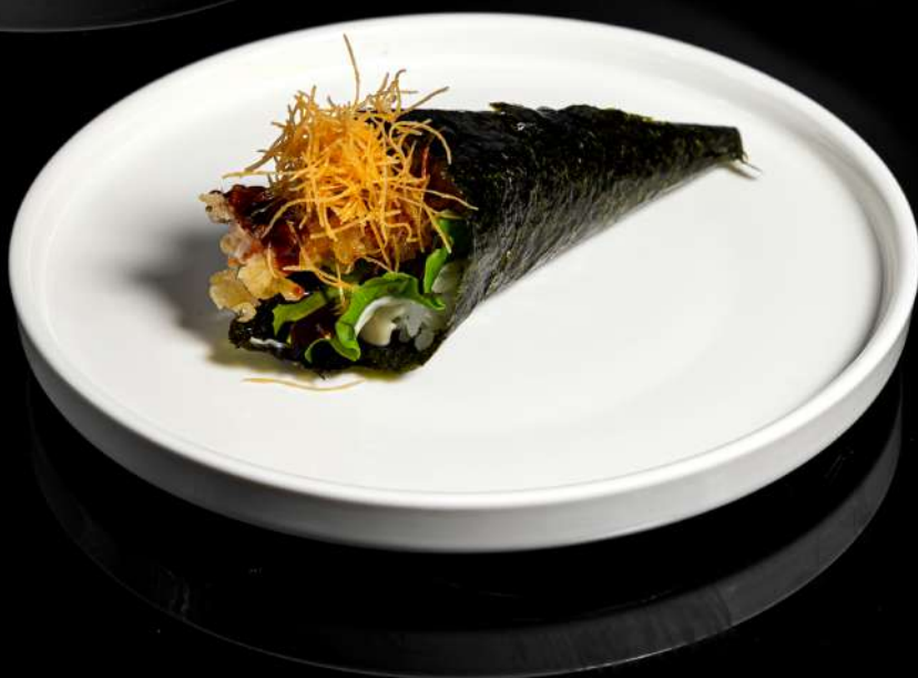
49. TEMAKI EBITEN € 5,00 insalata,gambero fritto, maionese,teriyaki,kataifi allergeni:1.2.3.6