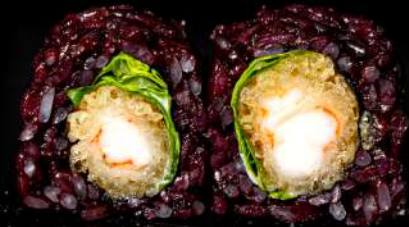
79. BLACK EBITEN € 10,00 gambero fritto, insalata, maionese, teriyaki, kataifi allergeni:1.2.3.6