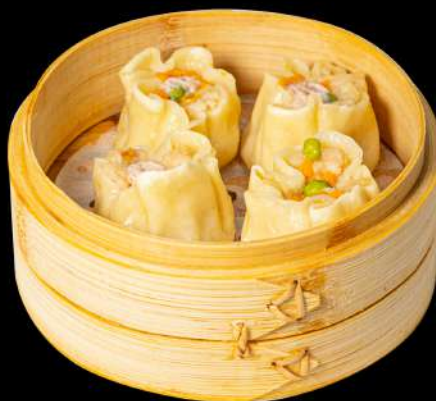
19. EBI* SHAOMAI € 5,00 3 ravioli di gamberi allergeni:2.1