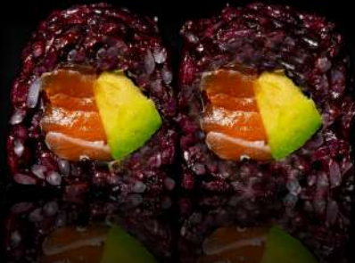
76. BLACK SAKE € 8,00 salmone, avocado allergeni:4