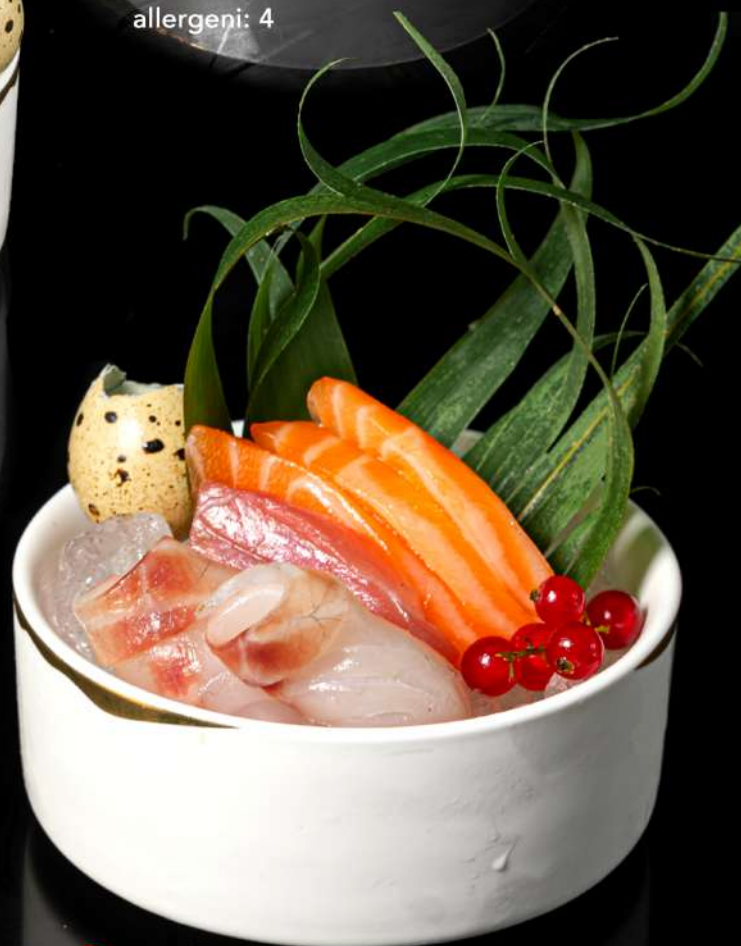
122. SASHIMI MISTO 5PZ € 15,00 5pz pesce misto allergeni: 4