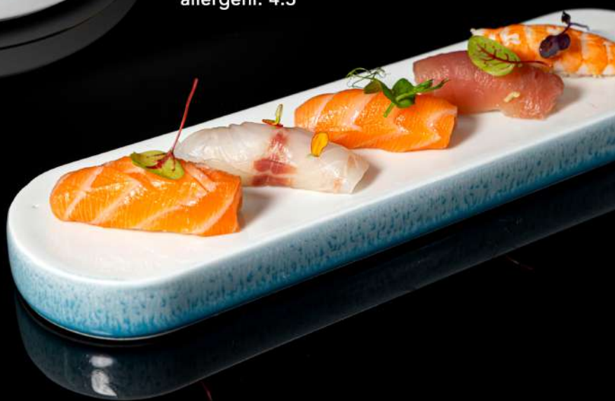
106. NIGIRI MISTO 5PZ € 10,00 5 pezzi nigiri misto allergeni:2.4