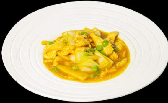
140. POLLO THAI € 8,00