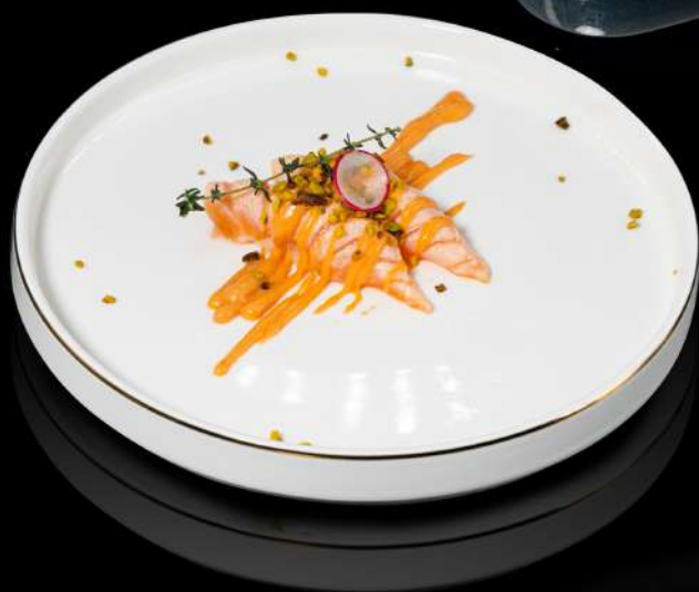
105. NIGIRI SAKE FLAMBÉ 2PZ € 4,50 con salsa flambé allergeni: 4.3