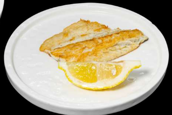
168. ORATA ALLA GRIGLIA € 10,00 allergeni: 4