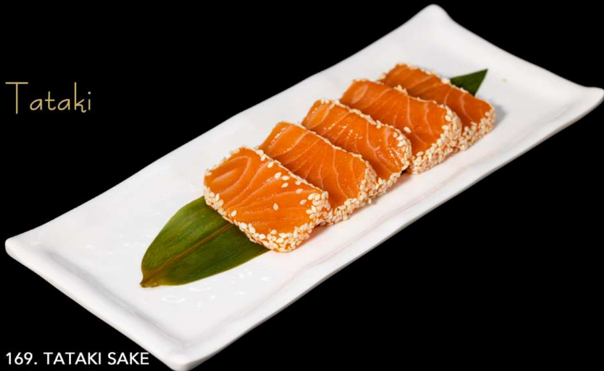
169. TATAKI SAKE 8PZ € 12,00 salmone scottato con sesamo in salsa allergeni: 4.11