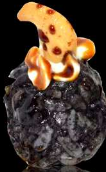
119. ANACARDI € 4,00 riso nero seppia, philadelphia anacardi e teriyaki allergeni:6.7