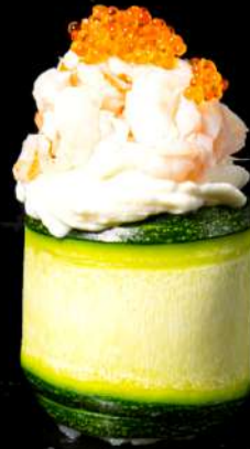
115. GUNKAN ZUCCHINE € 4,00 philadelphia, gambero cotto allergeni:2.7