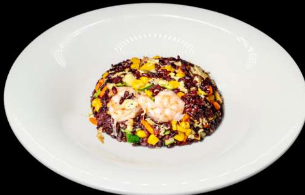
128. BLACK SAKE MESHİ € 7,00 riso venere saltato con salmone e verdure allergeni: 2.3