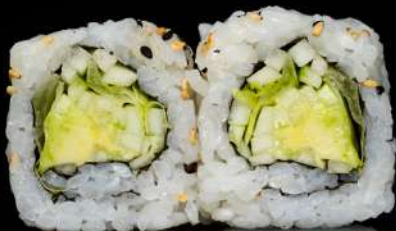
71. YASAI insalata,avocado, cetriolo,philadelphia allergeni:7.11