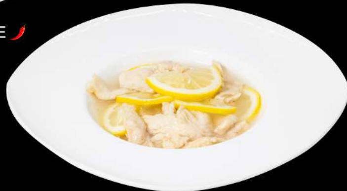
143. POLLO AL LIMONE € 8,00