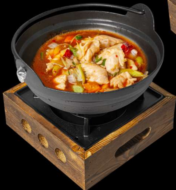
● 172. PENTOLA DI POLLO PICCANTE 🌶️ € 12,00