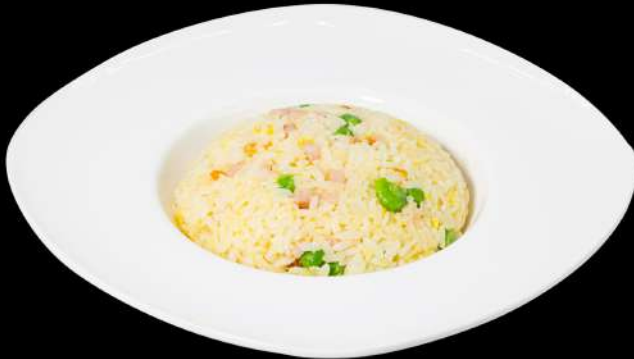
127. RISO CANTONESE € 5,00 riso saltato con prosciutto e piselli allergeni: 2.6