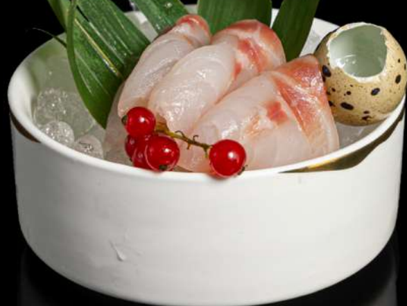
121. SASHIMI SUZUKI 5PZ € 12,00 5 pz branzino allergeni: 4