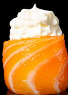
109. GIO WHITE € 4,00 philadelphia allergeni: 4.7