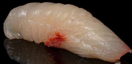
95. HAMACHI € 4,00 ricciola allergeni: 4