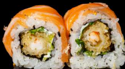
72. TIGER ROLL € 12,00 gambero fritto,insalata,maionese, salmone all'esterno,salsa teriyaki allergeni:1.2.3.4.6.11