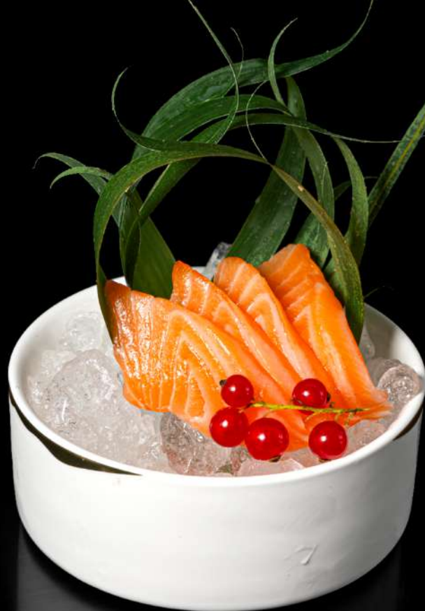
120. SASHIMI SAKE 9PZ € 12,00 5 pz salmone allergeni: 4