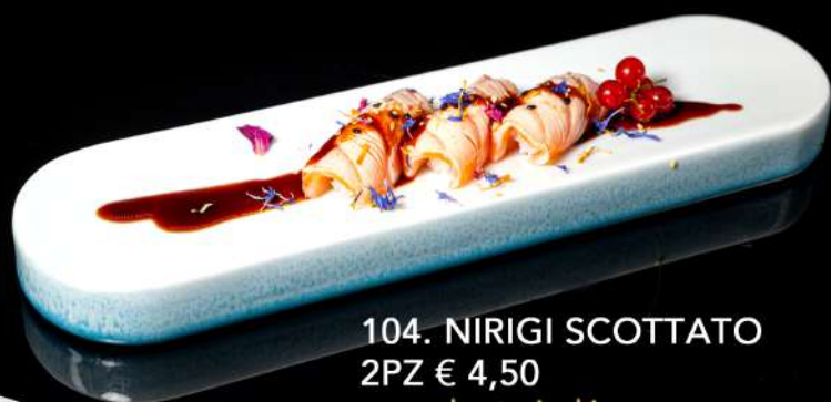
104. NIGIRI SCOTTATO 2PZ € 4,50 con salsa teriyaki allergeni:4.6