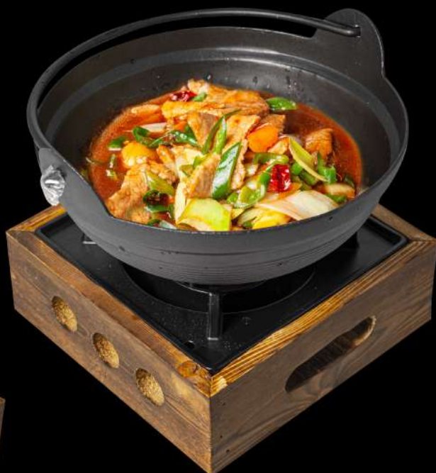
● 175. PENTOLA DI MANZO PICCANTE 🌶️ € 12,00