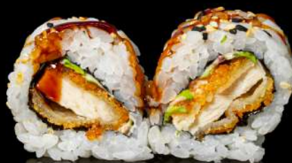
70. CHICKEN ROLL € 9,00 pollo fritto,insalata, spicy maio,teriyaki allergeni:1.3.6