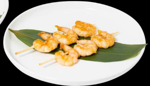
164. YAKI EBI 4PZ € 10,00 spiedini di gamberi in salsa teriyaki allergeni:2.6