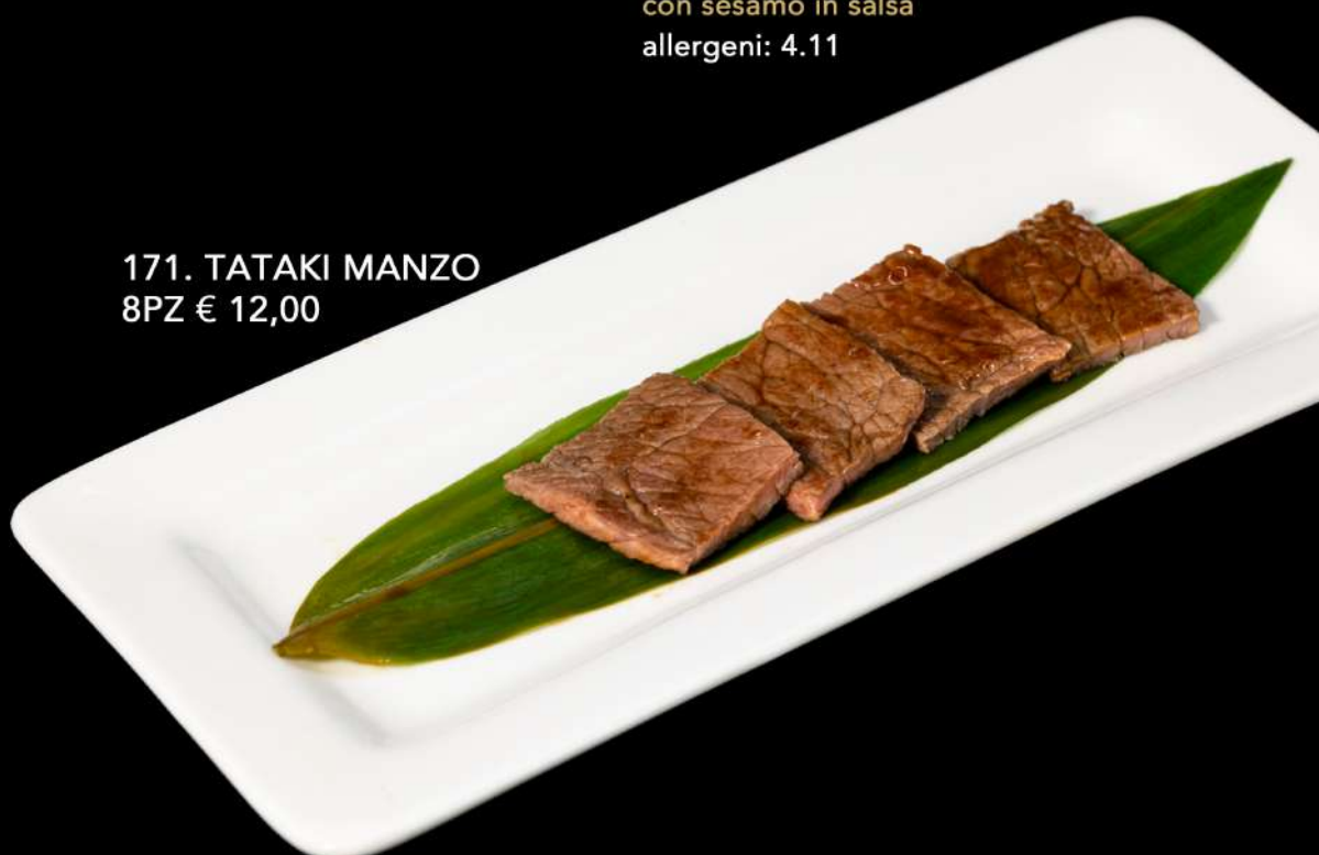
171. TATAKI MANZO 8PZ € 12,00