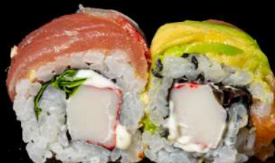
74. RAINBOW ROLL € 12,00 surimi,gambero cotto,cetrioli, all'esterno pesce misto allergeni:2.4