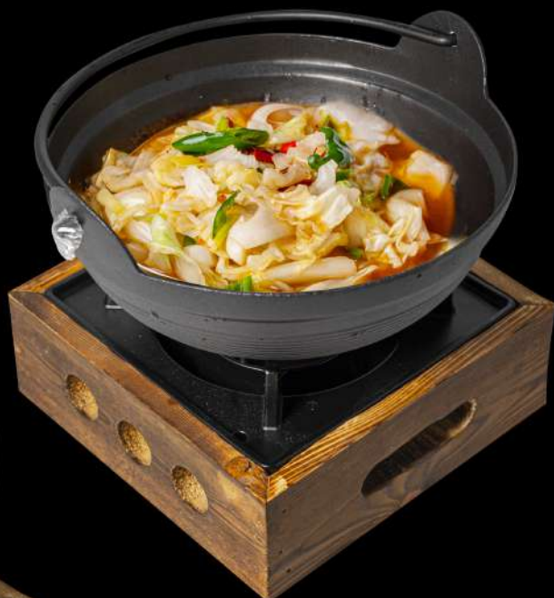
● 173. PENTOLA DI VERDURE PICCANTE 🌶️ € 12,00