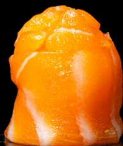
108. GIO SPICY SAKE € 4,00 🍣 tartare di salmone piccante, tobiko allergeni:4