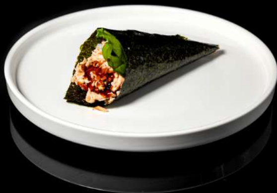
46. TEMAKI MIURA € 5,00 insalata,salmone cotto,teriyaki allergeni:4.6