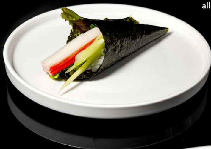
48. TEMAKI CALIFORNIA insalata,avocado,cetrioli, surimi,maionese allergeni:2.3