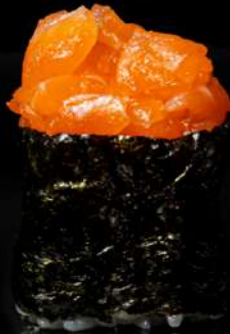
116. GUNKAN SAKE bocconcino di riso con salmone avvolto da alga allergeni:4