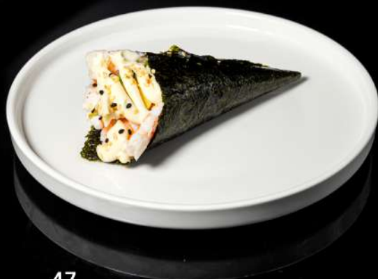
47. TEMAKI EBI € 5,00 insalata,avocado,gambero cotto, maionese,sesamo allergeni:2.3.11