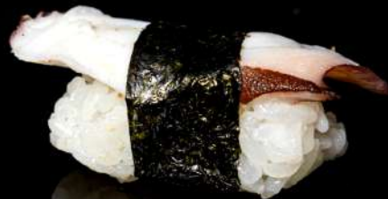
97. POLIPO € 4,00 Polipo allergeni:14