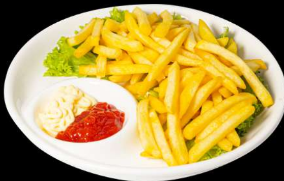
160. PATATINE FRITTE € 4,50 allergeni:1