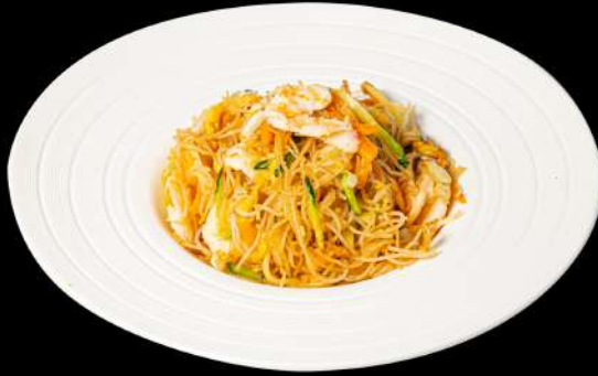
135. SPAGHETTI DI RISO EBI € 6,00 spaghetti di riso saltato con gamberi e verdure allergeni:2.3