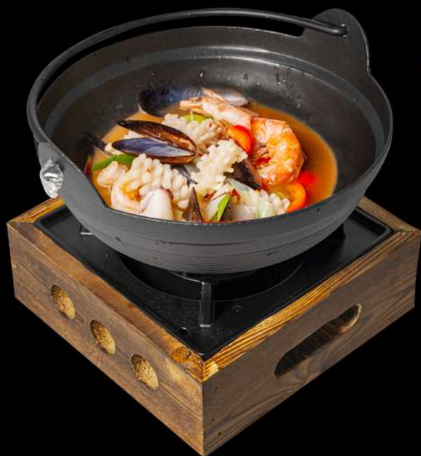
● ● 174. PENTOLA DI FRUTTI DI MARE PICCANTE 🌶️ € 12,00 allergeni: 2