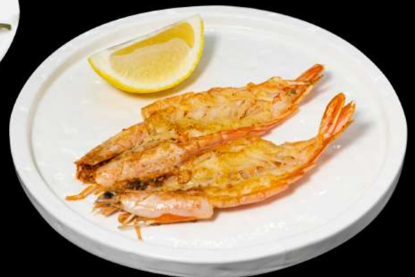
166. GAMBERONI ALLA GRIGLIA 4PZ € 12,00 allergeni:2